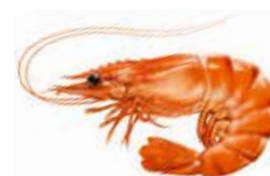
Garnelen Aufzucht – wirklich guten Appetit? Seite 20

www.tierheim-krefeld.de Flünnertzdyk 190 47802 Krefeld Tel. 02151 - 562137 Fax 02151 - 560059 tsz@tierheim-krefeld.de