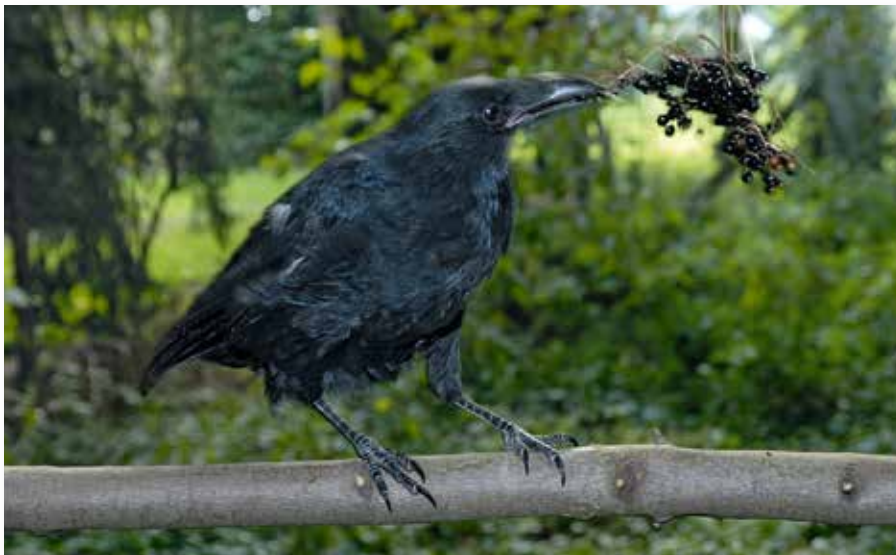
Krähen sind neugierig, intelligent und werden bis zu 40 Jahre alt