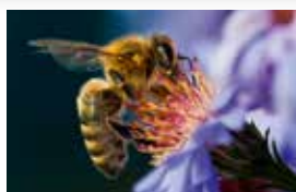
Hilfe für die Bienen – bevor es zu spät ist Seite 2