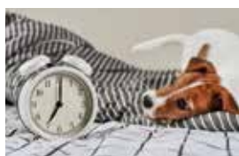
Nachgeforscht – Können Tiere die Uhr lesen? Seite 10