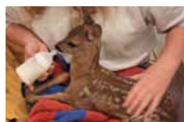
Rehkitze als Flaschenkinder – Wildtierbetreuung im Tierheim Seite 18