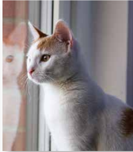
Ob Katzen auch ihren Geruchssinn zur Zeiterfassung benutzen, ist bis dato nicht erforscht.

und Linda Keeling haben festgestellt, dass Hunde – je nach Dauer der Abwesenheit des Besitzers – bei dessen Rückkehr ein anderes Verhalten an den Tag legen. Die Studie zeigte klar, dass die Hunde nach zwei Stunden etwa viel mehr mit dem Schwanz wedelten und das Gesicht der Probanden ableckten als nach 30 Minuten.