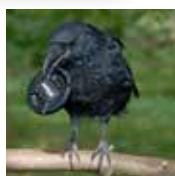
Richtig clever – und richtig unbeliebt Seite 6